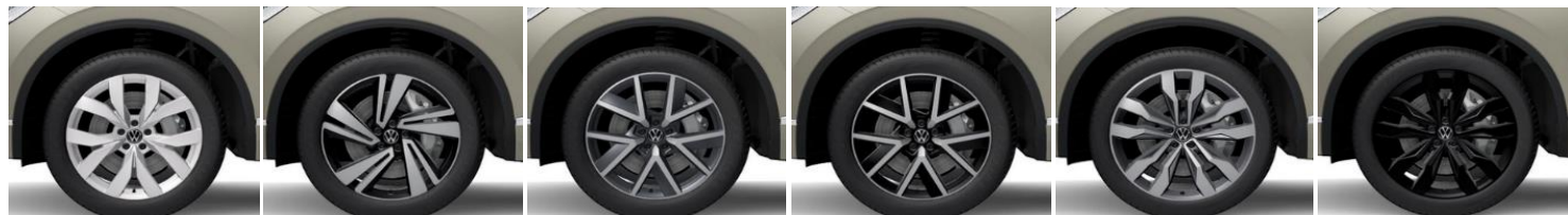
Легкосплавные колесные диски "Montero" 9J x 20 (PJF) Легкосплавные колесные диски "Nevada" 9J x 20 (PJ2) стандарт Exclusive R-line Black Style Легкосплавные колесные диски "Braga" 9J x 20 (PJ3) Легкосплавные колесные диски "Braga" 9J x 20 (PJ4) Легкосплавные колесные диски "Suzuka" 9,5J x 21 (PJ5) Легкосплавные колесные диски "Suzuka" 9,5J x 21 (PJ6)