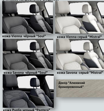
кожа Vienna чёрный "Soul" кожа Vienna серый "Mistral" кожа Savona чёрный "Soul" кожа Savona серый "Mistral" Декор "Алюминий брашированный"