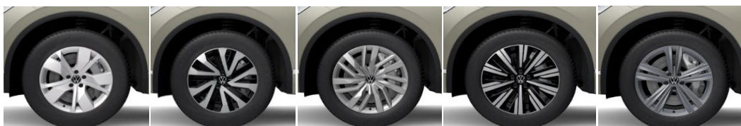
Легкосплавные колесные диски "Cordova" 8J x 18 Легкосплавные колесные диски "Concordia" 8J x 18 Легкосплавные колесные диски "Osorno" 8J x 19 (PJB) стандарт Exclusive Легкосплавные колесные диски "Tirano" 8,5J x 19 (PJC) Легкосплавные колесные диски "Sebring" 8,5J x 19 (PJD) стандарт Business R-line