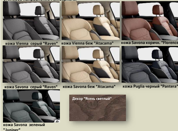
кожа Vienna серый "Raven" кожа Vienna беж "Atacama" кожа Savona корич. "Florence" кожа Savona серый "Raven" кожа Savona беж "Atacama" кожа Puglia чёрный "Pantera" кожа Savona зелёный "Juniper" Декор "Ясень светлый"