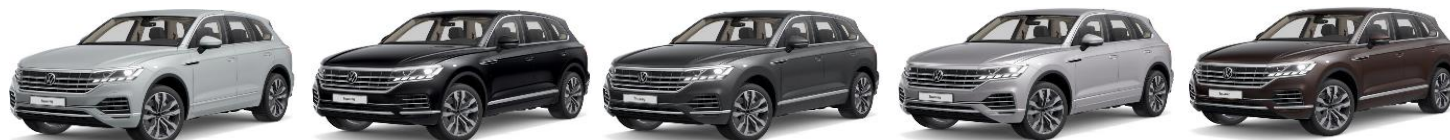
Белый "Огук", премиум перламутр Черный "Деер", перламутр Серый "Silicium", металл Серебристый "Antimonial", металл Коричневый "Tamarind", металл