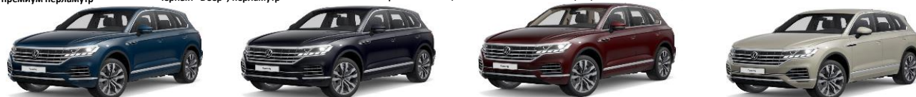
Синий "Aquamarine", металл эксклюзив Синий "Moonlight", перламутр Красный "Malbec", металл эксклюзив Бежевый "Sechura", металл эксклюзив